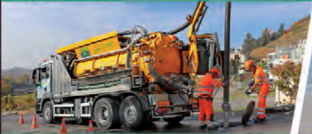
KUNZLI FRERES SA