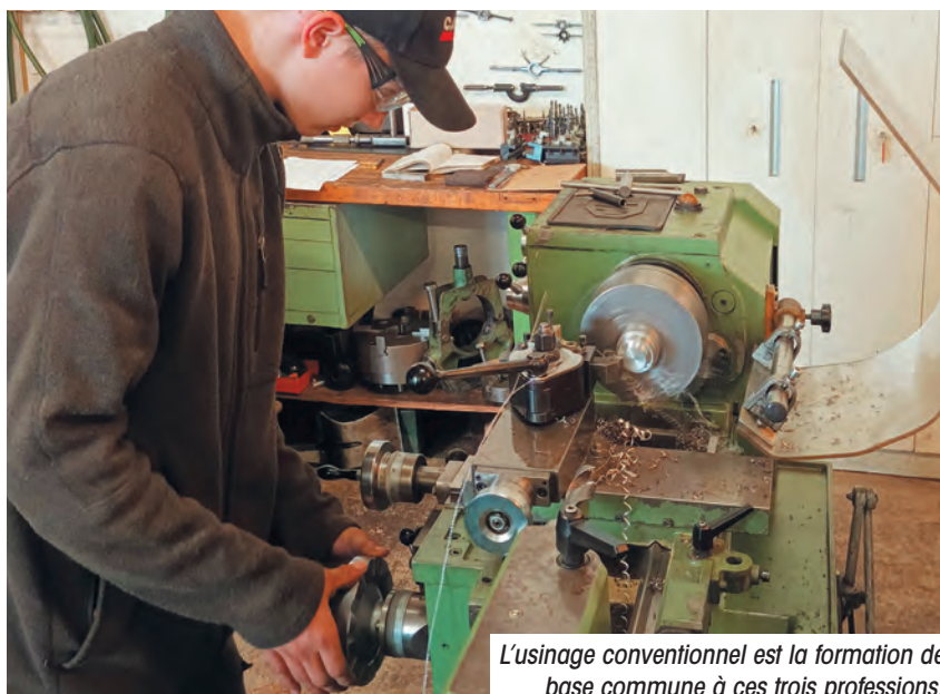
L'usinage conventionnel est la formation de base commune à ces trois professions.